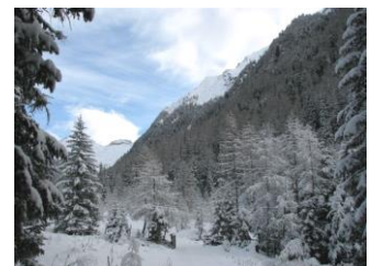
Blick ins Kaponigtal